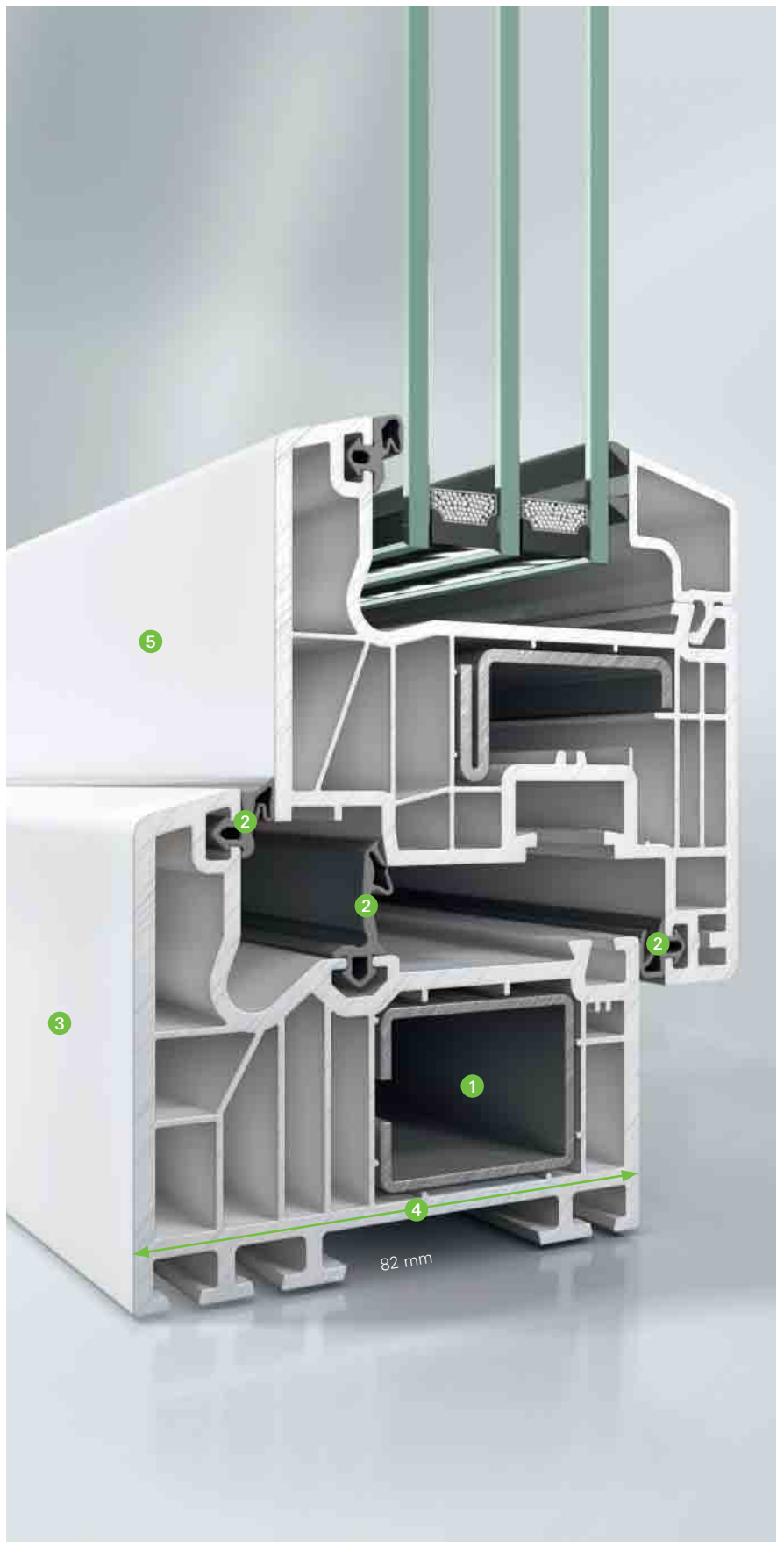
Schüco Thermo 6-vinduesprofilsystem med Classic-kontur